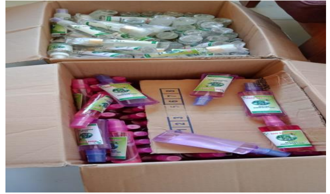
Foto : Bantuan Hand Sanitizer

Demikian laporan Tim Pelaksana, untuk menjadikan periksa.