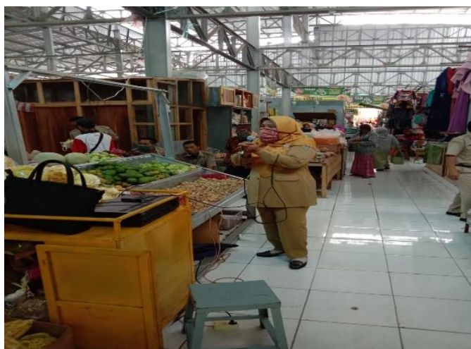
Foto : Pasar Bojong