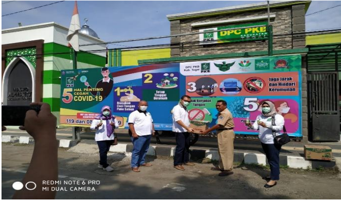
Foto : Bantuan Hand Sanitizer