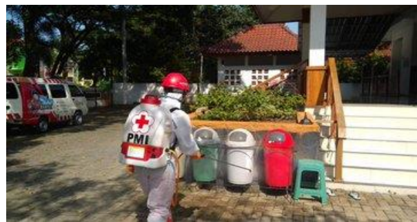
Masjid Al Hajj