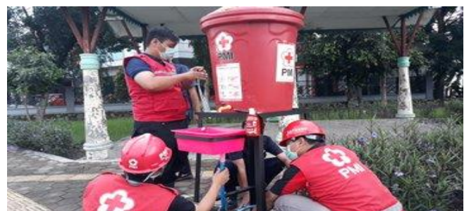
Alat Cuci Tangan Portabel-Alun2 Hanggawana

Sebagai bentuk pencegahan penularan Covid-19