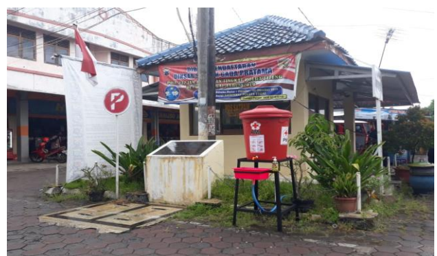
Alat Cuci Tangan Portabel-Rulo Slawi