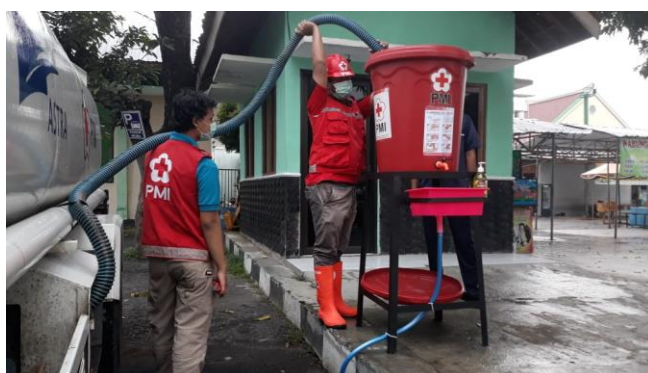
Alat Cuci Tangan Portabel-Trasa Slawi