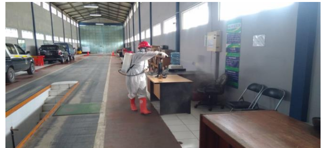
Kantor Dinas Perhubungan