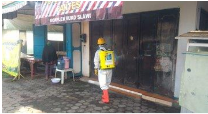
Ruko Pasar Slawi

Palang Merah Indonesia (PMI) melaksanakan penyemprotan desinfektan di Lingkungan Ruko Pasar Slawi, Terminal Maribaya, Terminal Slawi, Kantor Dinas Perhubungan, Pasar Lebaksiu, Terminal Yomani