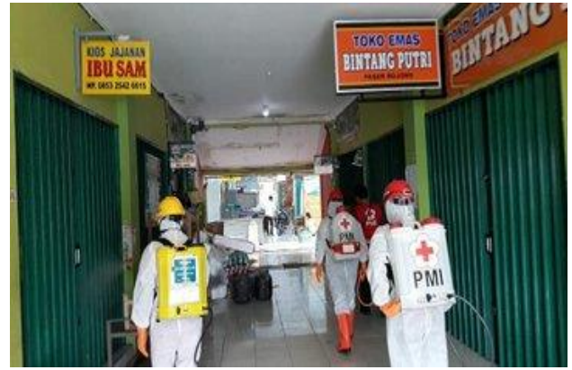
Pasar Bojong– (17/04/2020)