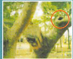
lubang pada pohon