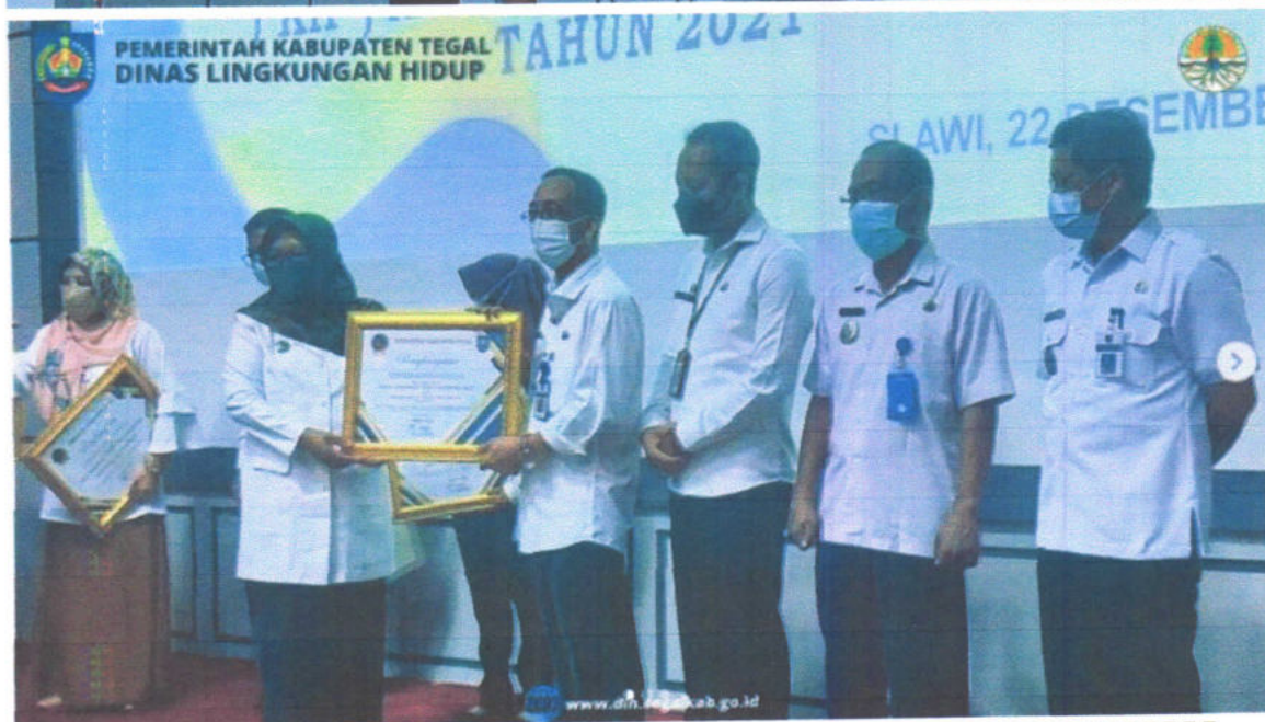
Gambar : DLH Kab. Tegal menerima penghargaan KIP AWARD 2021 dari Bupati Tegal