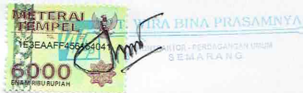
SUKAHAR Direktur Utama

Menerima dan Menyetujui : Untuk dan Atas Nama PT. WIRA BINA PRASAMNYA Penyedia Jasa