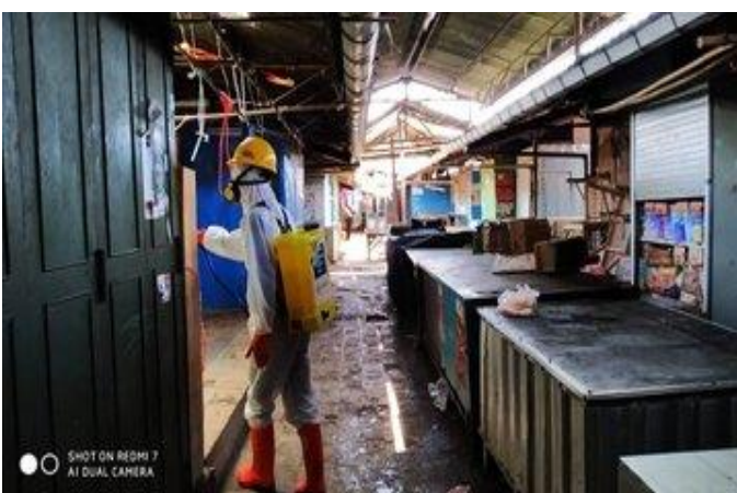
Pasar Bumijawa (24/04)