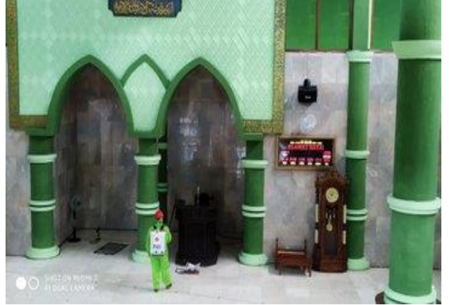
Masjid Agung Slawi (24/04)