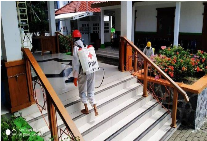
Masjid Al Hajj (24/04)