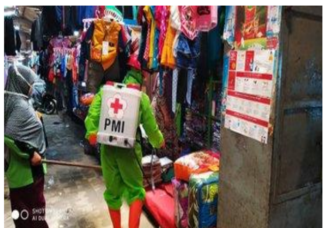
Pasar Jejeg (24/04)