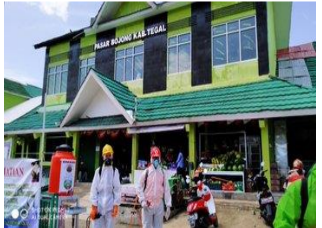
Pasar Bojong (24/03)