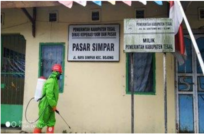
Pasar Simpar (24/04)