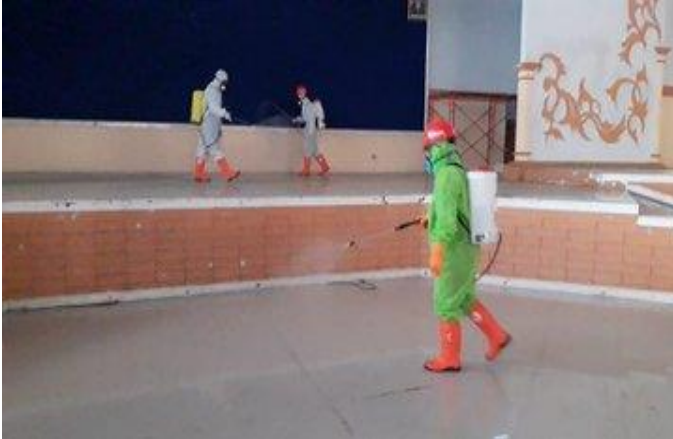
Gedung KORPRI (24/04)