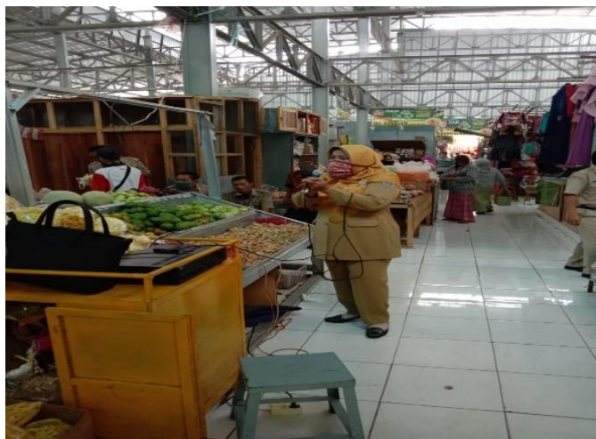
Foto : Pasar Bojong