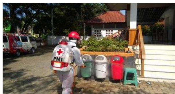
Masjid Al Hajj