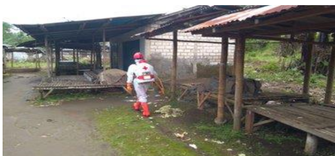
Pasar Simpar Kecamatan Bojong