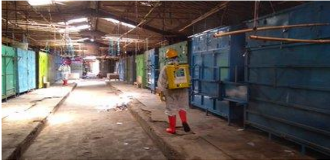
Pasar Bumijawa Kecamatan Bumijawa