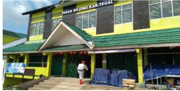
Pasar Bojong Kecamatan Bojong

Demikian laporan Tim Pelaksana, untuk menjadikan periksa.