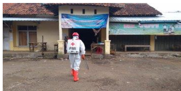
Pasar Jejeg Kecamatan Bumijawa