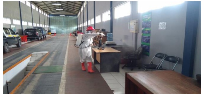
Kantor Dinas Perhubungan