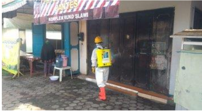
Ruko Pasar Slawi

Palang Merah Indonesia (PMI) melaksanakan penyemprotan desinfektan di Lingkungan Ruko Pasar Slawi, Terminal Maribaya, Terminal Slawi, Kantor Dinas Perhubungan, Pasar Lebaksiu, Terminal Yomani