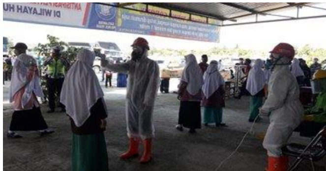
Penyemprotan Santri Ponpes Gontor Di Terminal Slawi, Minggu (12/04/2020)