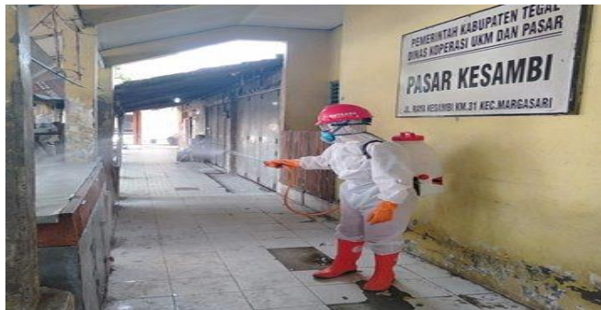
Pasar Kesambi-Margasari, Sabtu (11/04/2020)