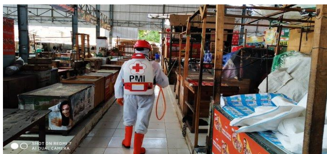
Pasar Pepedan-Dukuhturi, Senin (13/04/2020)