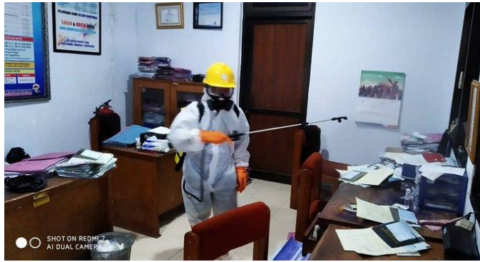
Kantor SAMSAT Slawi, Senin (13/04/2020)