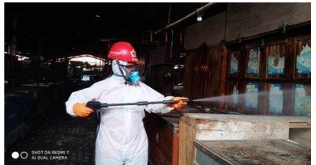
Pasar Bawang-Adiwerna, Selasa (14/04/2020)