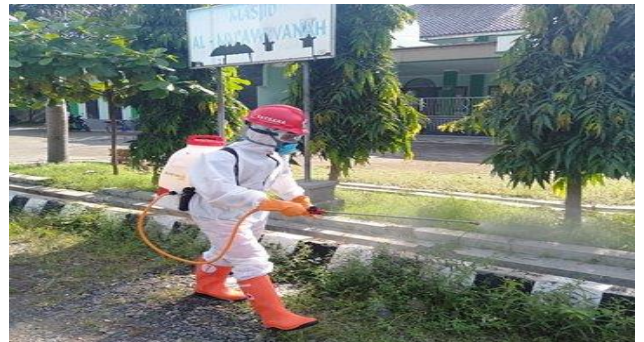
Terminal Prupuk-Margasari, Sabtu (11/04/2020)