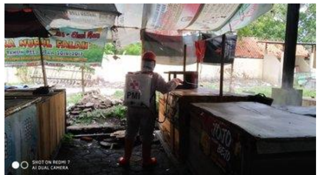
Pasar Mejasem-Kramat, Selasa (14/04/2020)