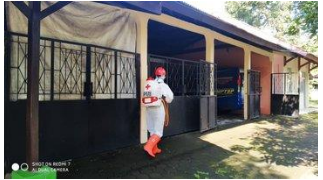
Kantor DPMPTSP, Selasa (14/04/2020)