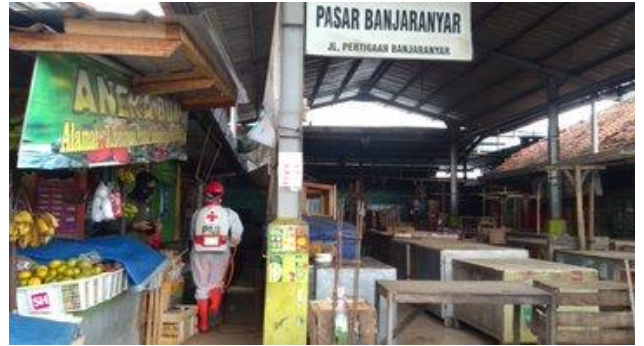
Pasar Banjaranyar-Balapulang, Sabtu (11/04/2020)