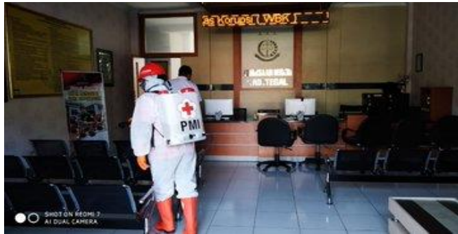
Kejaksaan Negeri Slawi, Selasa (14/04/2020)