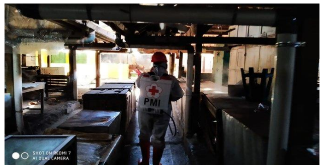
Pasar Kupu-Dukuhturi, Senin (13/04/2020)