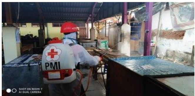
Pasar Kedung Sukun-Adiwerna, Senin (13/04/2020)