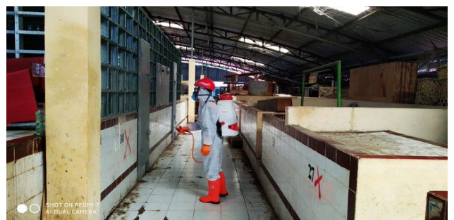
Pasar Trayeman-Slawi, Senin (13/04/2020)