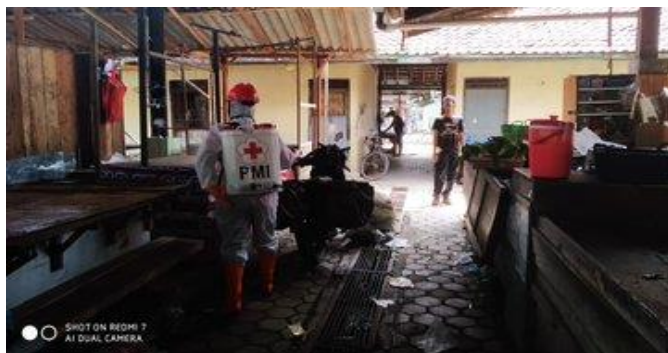
Pasar Mejasem-Kramat, Selasa (14/04/2020)