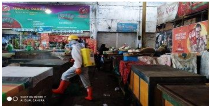
Pasar Banjaran-Adiwerna, Selasa (14/04/2020)