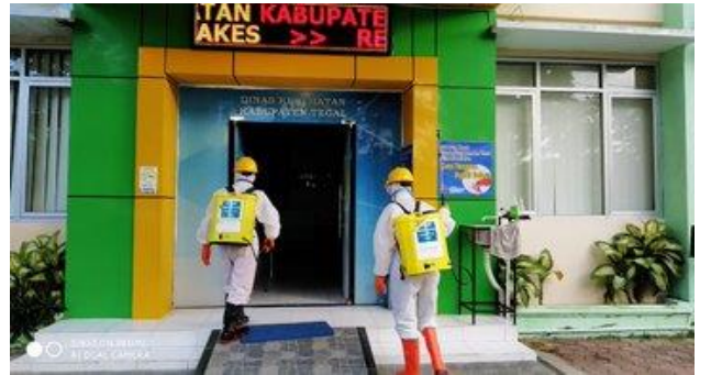
Labotorium Dinas Kesehatan, Selasa (14/04/2020)