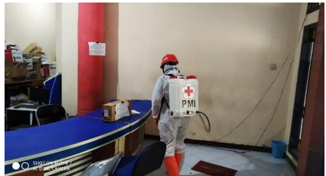
Kantor Disdukcapri, Senin (13/04/2020)