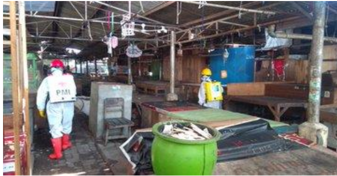
Pasar Balapulang, Sabtu (11/04/2020)

Palang Merah Indonesia (PMI) Kabupaten Tegal melaksanakan Giat Penyemprotan Desinfektan di beberapa pasar dan terminal serta OPD di seluruh Kabupaten Tegal untuk mencegah penularan Covid19 pada Sabtu (11/04/2020) sampai dengan Selasa (14/04/2020).