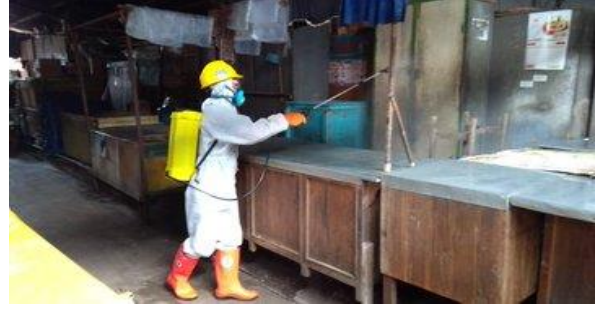
Pasar Suradadi – (15/04/2020)