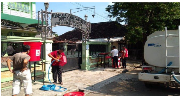
Pemasangan Tempat Cuci Tangan Portabel di Masjid An-Nur Slawi – (17/04/2020)