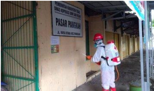
Pasar Pangkah – (15/04/2020)