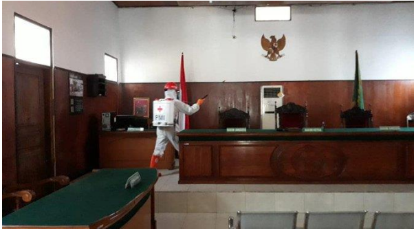
Pengadilan Negeri Slawi – (17/04/2020)