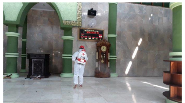
Masjid Jami Slawi- (17/04/2020)