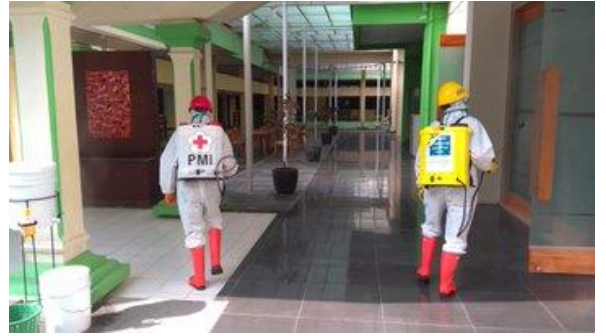
Lingkungan Pemkab Tegal – (16/04/2020)