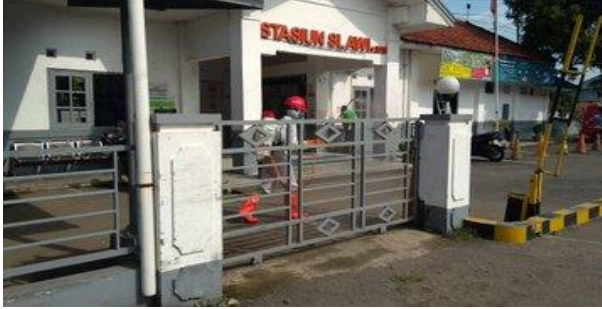
Stasiun Kereta Api Slawi – (16/04/2020)