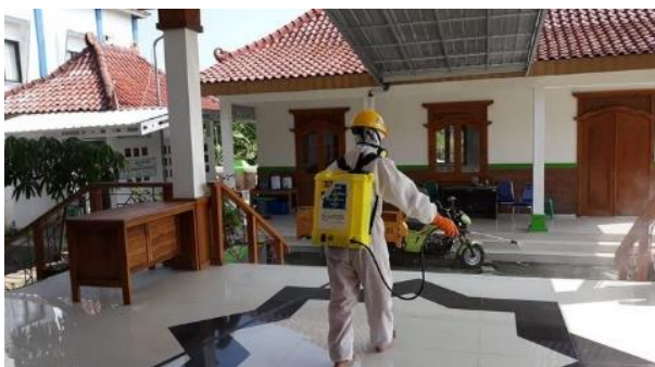
Masjid Al Hajj-Slawi- (17/04/2020)

Palang Merah Indonesia Kabupaten Tegal melaksanakan giat penyemprotan desinfektan di sejumlah Kantor Pemerintah, Tempat Ibadah Dan Pasar di Kabupaten Tegal serta pemasangan tempat cuci tangan portabel dari tanggal (15/04/2020) sampai dengan (17/04/2020) dan akan terus dilaksanakan di lokasi-lokasi publik lainnya.