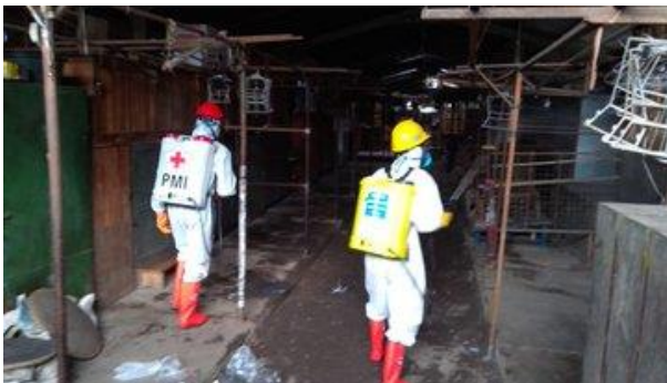
Pasar Balamoa – (15/04/2020)