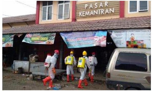
Pasar Kemantran – (15/04/2020)