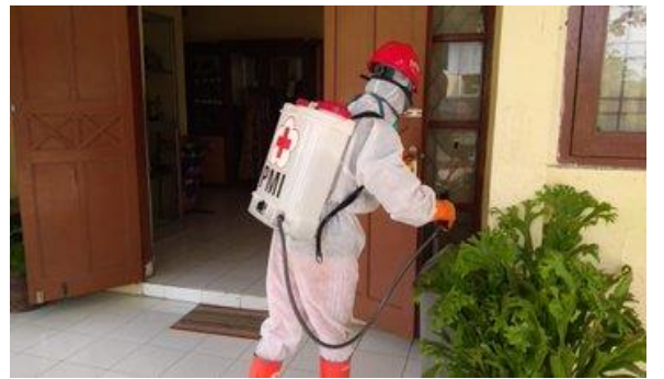
Dinas Perinaker – (15/04/2020)