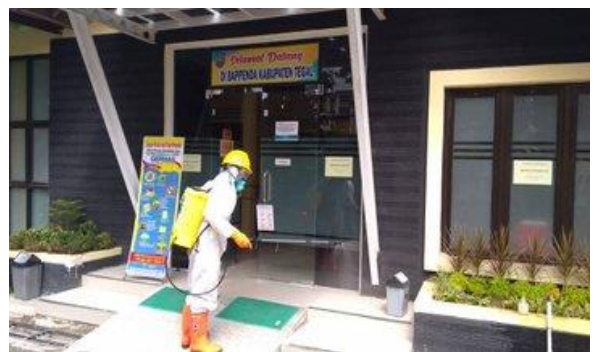
BAPENDA – (15/04/2020)