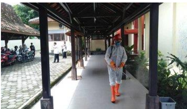
Dinas DAKOPUKM – (15/04/2020)