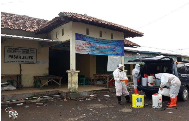
Pasar Jejeg Kec. Bumijawa – (17/04/2020)