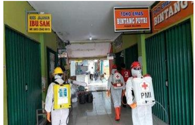
Pasar Bojong– (17/04/2020)