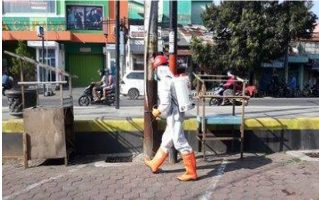
Ruko Pasar Slawi- (18/04/2020)

Palang Merah Indonesia Kabupaten Tegal melaksanakan giat penyemprotan desinfektan di sejumlah Pasar di Kabupaten Tegal dari tanggal (17/04/2020) sampai dengan (18/04/2020) dan akan terus dilaksanakan di lokasi-lokasi publik lainnya.