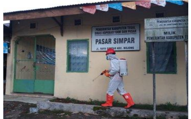
Pasar Simpar Kec. Bojong- (17/04/2020)