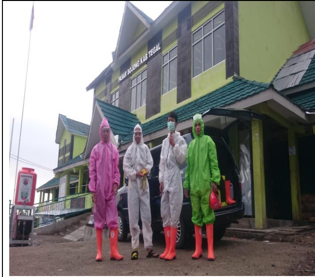
Giat PMI Kabupaten Tegal, Penyemprotan Desinfektan di Pasar Bojong (1/5/20)