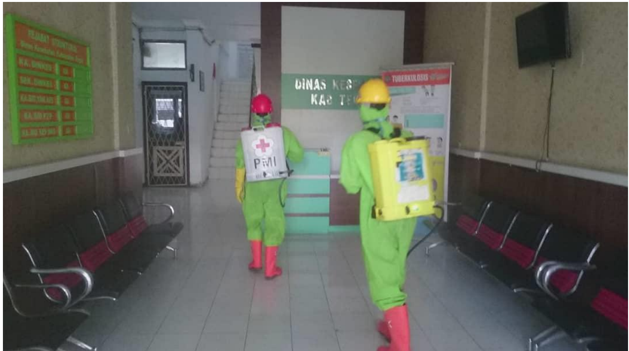
Giat Penyemprotan Desinfektan oleh PMI Kabupaten Tegal di lingkungan kantor Dinas Kesehatan Kabupaten Tegal.