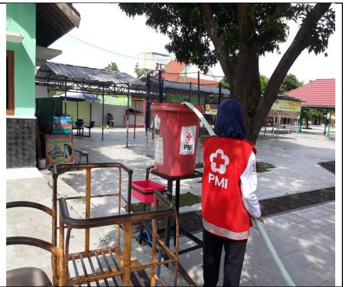
PMI Kab. Tegal mengadakan Giat pengisian Air Bersih untuk sarana Cuci tangan Pencegahan Covid-19. Lokasi Alun-alun Hanggawana Slawi, Ruko Slawi dan Taman Rakyat (Trasa) Slawi.