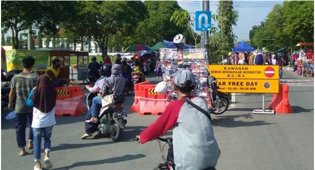
Keramaian di CFD Alun-alun Hanggawana Slawi, Kabupaten Tegal.