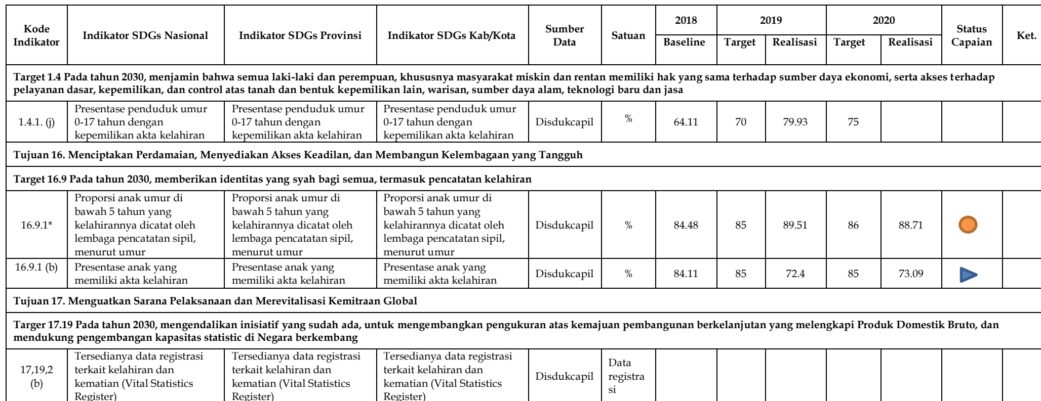
EVALUASI KINERJA SDGs TAHUN LALU Tabel 2.3 Indikator TPB/SDGs PROVINSI KABUPATEN TEGAL TAHUN 2019-2024