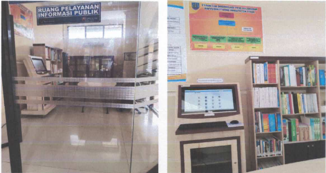
Gambar 1. Ruang Pelayanan Informasi Publik

Pelayanan informasi pada Bappedalitbang Kabupaten Tegal dilakukan pada ruang pelayanan informasi publik yang bertempat di Lantai 1 (satu). Ruangan ini dilengkapi dengan dengan 1 (satu) unit meja pelayanan, 1 (satu) buah anjungan informasi mandiri (Komputer), dan fasilitas lainnya, serta formulir -formulir yang diperlukan.