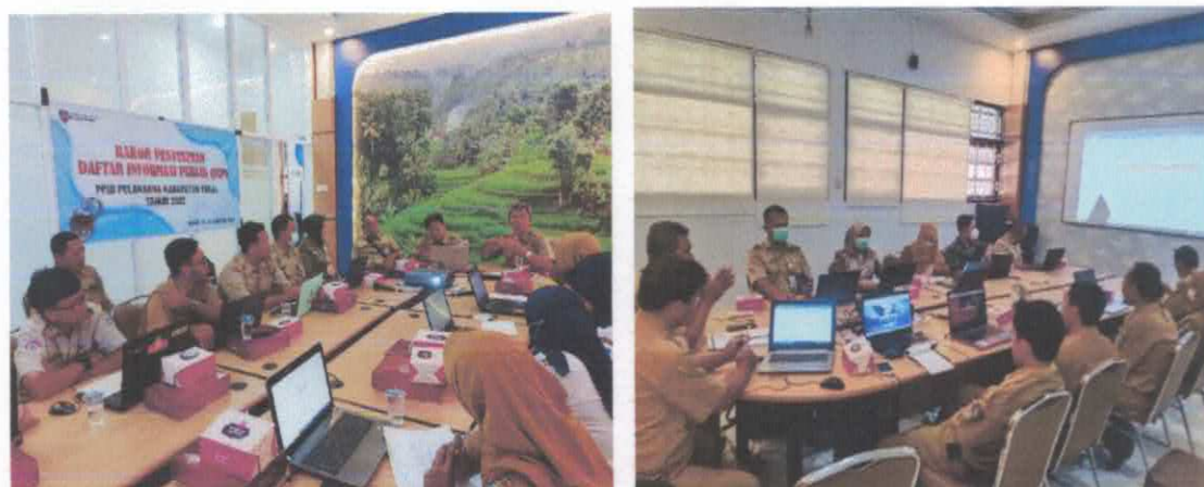
Gambar 6. Rakor Penyusunan DIP PPID Pelaksana di Kabupaten Tegal

Materi : a. Peningkata Kualitas Pelayanan Informasi Publik bagi OPD Selaku Badan Publik yang Informatif. b. Memperkuat Peran PPID dalam pelayanan Informasi Publik.