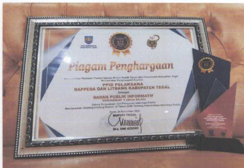
Gambar 9. Plakat dan Piagam Penghargaan PPID Pelaksana Bappedalitbang sebagai Peringkat Pertama Penganugerahan KIP Award Kabupaten Tegal 2022

Sebagai Penghargaan bagi OPD selaku Badan Buplik yang Informatif diberikan Piagam Penghargaan dan Plakat dari Pemerintah Kabupaten Tegal dan Bagi OPD Kategori Badan Publik Informatif 1 diberikan penghargaan seekor Kambing dari Sekretaris Daerah Kabupaten Tegal.