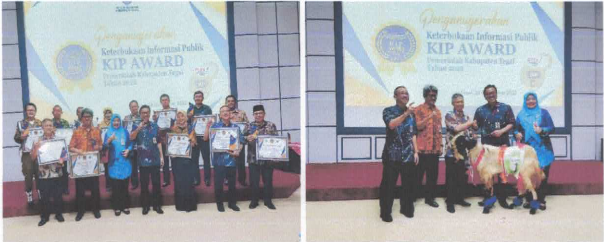
Gambar 8. Penganugerahan KIP Award Kabupaten Tegal

optimal. Inovasi dan terobosan dalam pelayanan informasi belum banyak diaplikasikan oleh badan publik. Konsistensi dalam implementasi UU KIP juga perlu ditingkatkan.