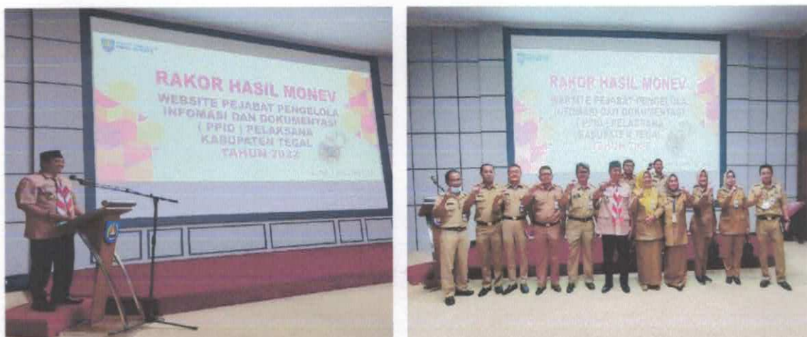
Gambar 5. Rakor Monev PPID Pelaksana di Kabupaten Tegal