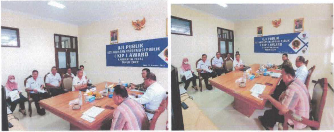
Gambar 7. Uji Publik PPID Pelaksana di Kabupaten Tegal