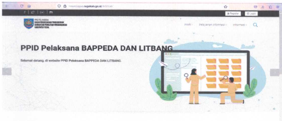
Gambar 2. Website PPID Pelaksana Bappedalitbang Kabupaten Tegal

Website PPID Pelaksana Bappedalitbang Kbaupaten Tegal memberikan layanan utama melalui menu “Informasi Publik” yang diklasifikasikan menjadi informasi yang wajib tersedia setiap saat, informasi yang wajib disediakan dan diumumkan secara berkala dan informasi yang wajib diumumkan secara serta-merta. Pada masing-masing halaman informasi publik disediakan kolom pencarian, untuk memudahkan pengguna mencari informasi dengan lebih cepat.