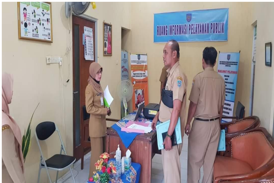
Gambar 2.3 Tim PPID Pelaksana DP3AP2 dan KB Kabupaten Tegal menerima Tim Verifikasi dan Visitasi dari Dinas Kominfo