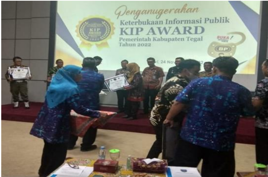
Gambar 2.7 Saat Penerimaan Penganugerahan KIP Award Pemerintah Kabupaten Tegal Tahun 2022