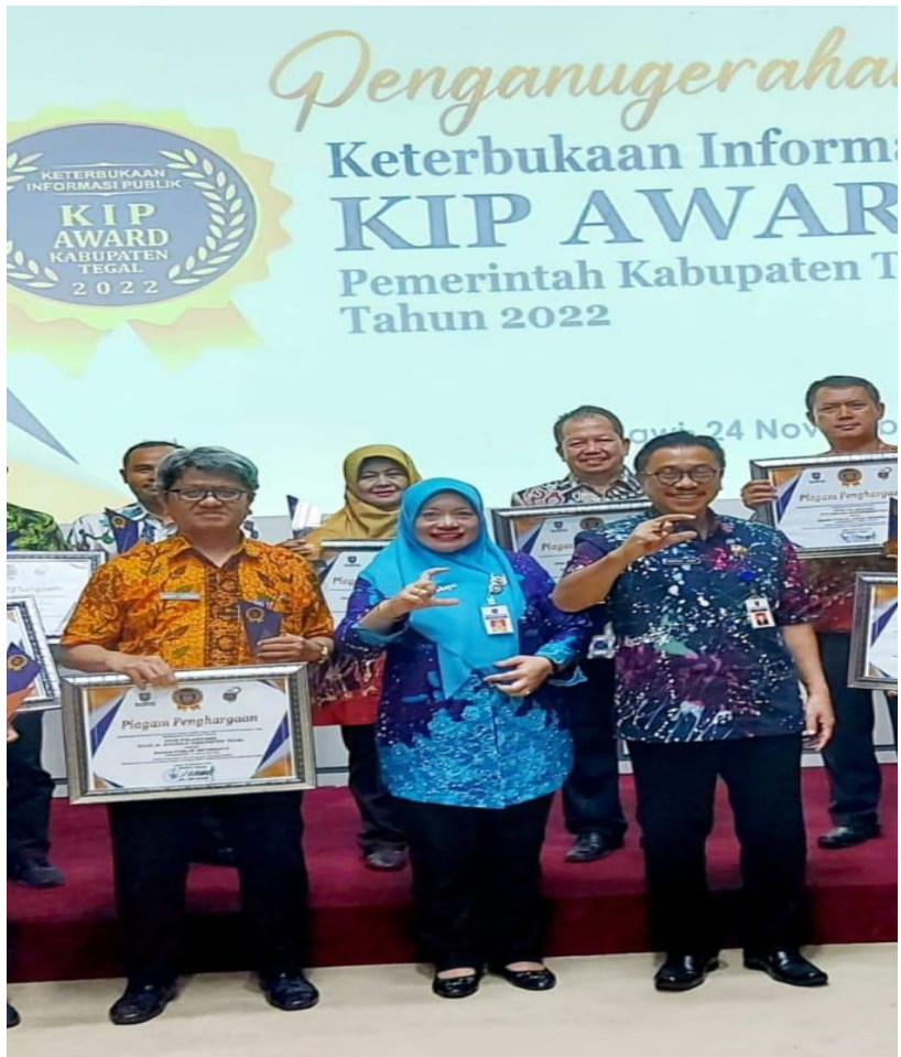
Gambar 2.6 Penganugerahan KIP Award Pemerintah Kabupaten Tegal Tahun 2022