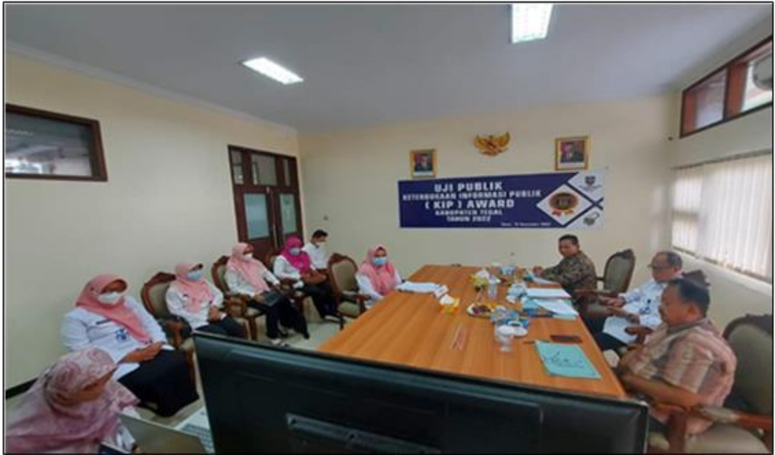
Gambar 2.5 Tim PPID Pelaksana DP3AP2 dan KB Kabupaten Tegal melaksanakan Uji Publik

Hasil dari seluruh proses dan tahapan tersebut, 4 (empat) OPD Kabupaten ditetapkan sebagai Badan Publik INFORMATIF, yaitu Bappeda dan Litbang, RSUD Soeselo, Dinas Sosial dan Dinas Lingkungan Hidup, 1 (satu) OPD ditetapkan sebagai Badan Publik MENUJU INFORMATIF Yaitu Satpol PP, dan 5 (lima) OPD ditetapkan sebagai Badan Publik CUKUP INFORMATIF Yaitu Dinas Perhubungan, Dinas Kepemudaan, Olah Raga dan Pariwisata, Dinas Pendidikan dan Kebudayaan, Dinas P3AP2KB dan Dinas Perikanan.