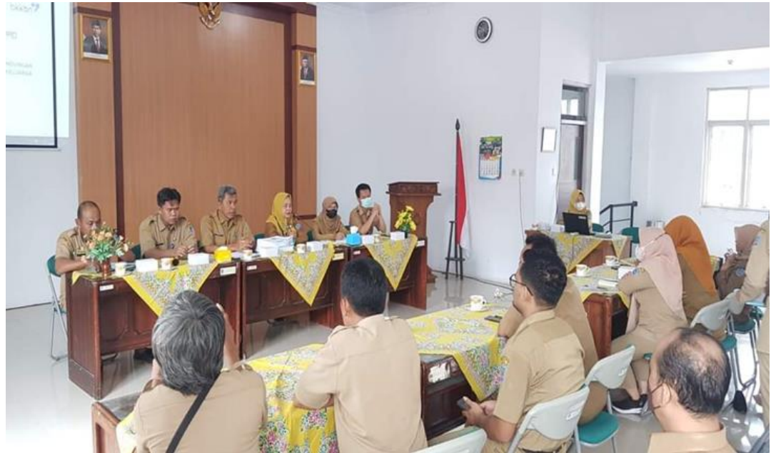
Gambar 2.2 Tim PPID Pelaksana DP3AP2 dan KB Kabupaten Tegal menerima Tim Verifikasi dan Visitasi dari Dinas Kominfo