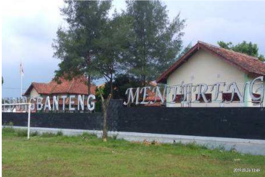
Gambar 1.1 Kantor Kecamatan Kedungbanteng