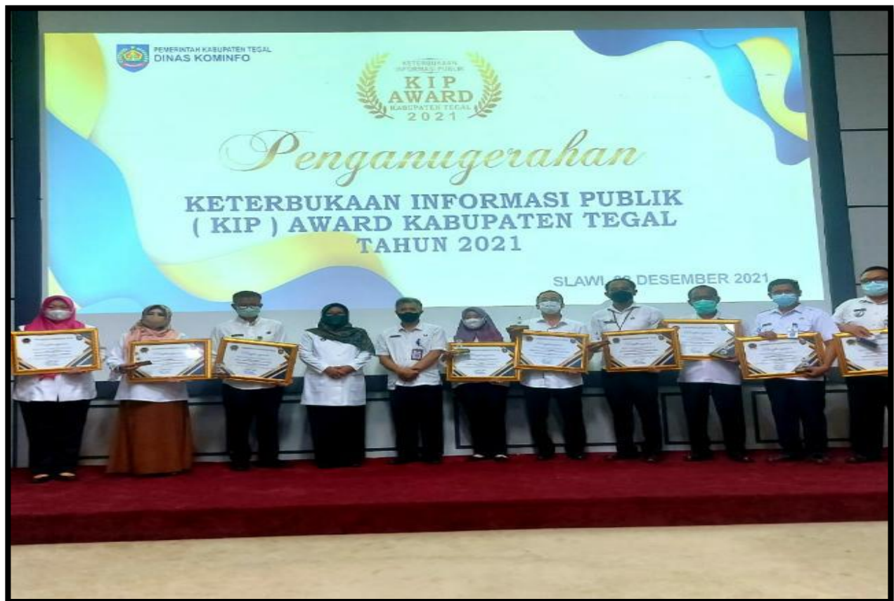
Gambar 6 : Penganugerahan Keterbukaan Informasi Publik (KIP) Award Kabupaten Tegal

Tahun 2021 merupakan awal peningkatan pelaksanaan PPID Pembantu di Dinas Sosial Kabupaten Tegal, adanya Keterbukaan Informasi Publik (KIP) Award Kabupaten Tegal yang diselenggarakan oleh Dinas Komunikasi dan Informatika Kabupaten Tegal yang dilaksanakan pada November 2021 disambut baik oleh pejabat lingkup Dinas Sosial untuk lebih meningkatkan tata kelola pemberian informasi kepada masyarakat baik dari segi variatifnya informasi yang disediakan dan juga peningkatan sarana prasarana penunjang. Capaian Pelaksanaan PPID Dinas Sosial Tahun 2021 yaitu Dinas Sosial memperoleh penghargaan peringkat pertama badan publik yang terbuka dalam mengelola keterbukaan informasi publik dengan kategori cukup informatif.