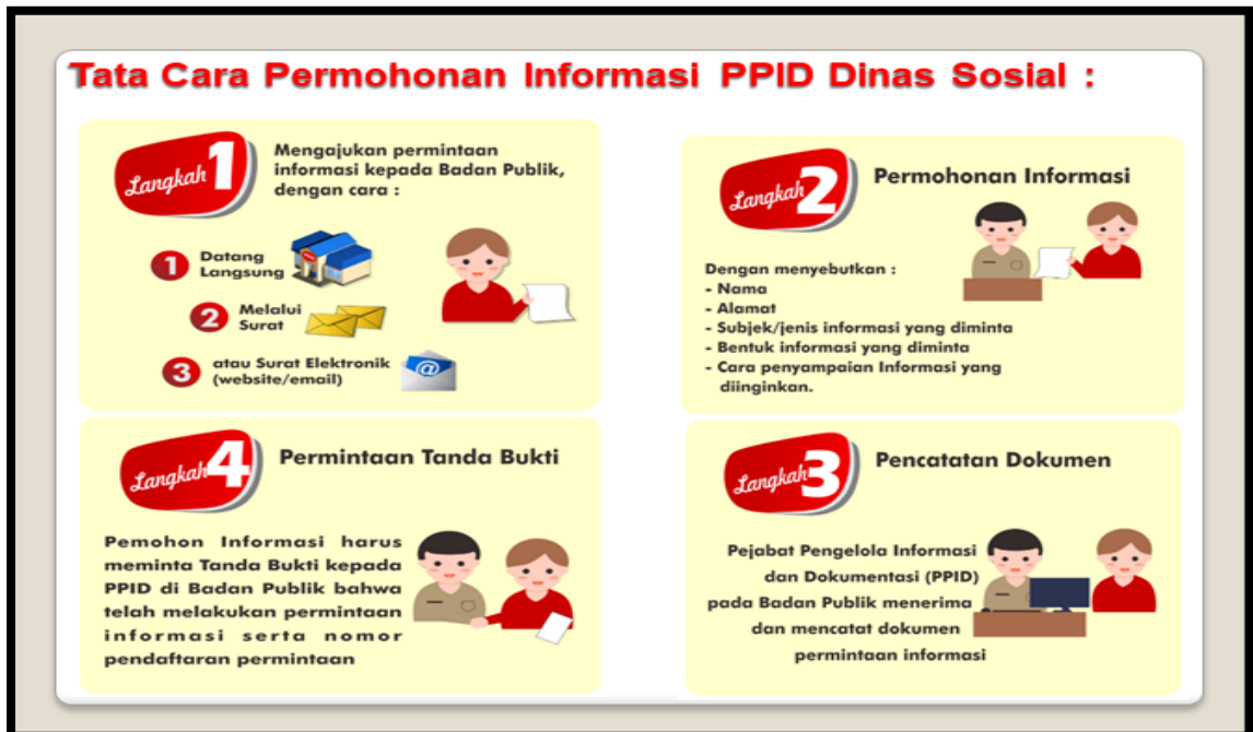
Gambar 2 : Alur/ Tata Cara Permohonan Informasi PPID Dinas Sosial