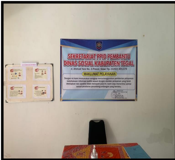
Gambar 4 : Meja Registrasi