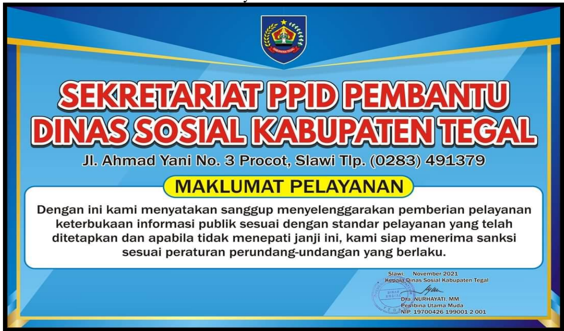
Gambar 1 : Maklumat Pelayanan Keterbukaan Informasi Publik