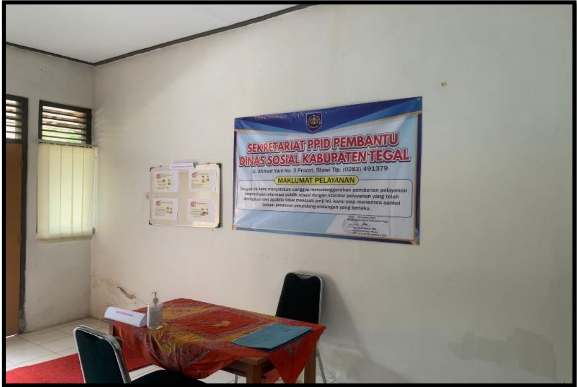
Gambar 3 : Ruang Pelayanan PPID