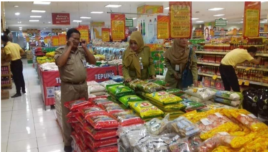
Gambar 3.1 Pengawasan Harga Kebutuhan Masyarakat

Hasil pengawasan harga bahan pokok setiap harinya diinput ke SIHATI yakni Sistem Harga Bahan Pokok dan Komoditi sebuah aplikasi yang dikelola oleh Bank Indonesia bekerja sama dengan Dinas Perindustrian dan Perdagangan Provinsi Jawa Tengah. SIHATI dapat diakses dengan alamat https://hargajateng.org/ . Pengawasan harga bahan pokok yang dilaksanakan Dinas Perdagangan Koperasi dan UKM juga dipublikasikan melalui media sosial seperti twitter.