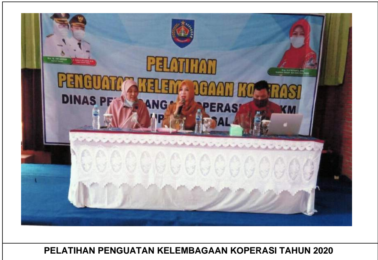
PELATIHAN Penguatan Kelembagaan Koperasi Tahun 2020

koperasi 100 % serta kegiatan Peningkatan Kapasitas Koperasi dan UKM (DAK) juga tercapai 100 % Sehingga capaian kinerjanya 154 % dan dikategorikan SANGAT BAIK .