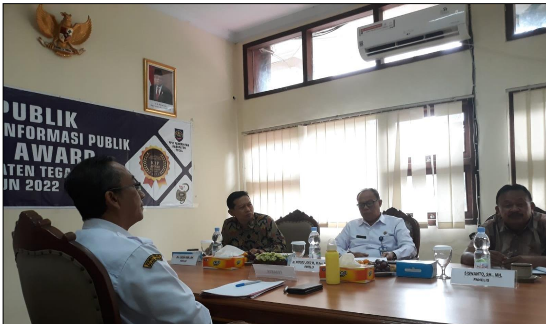
Gambar 5.4 Tim PPID Pelaksana DLH Kabupaten Tegal melaksanakan Uji Publik

Berikut dokumentasi Tim PPID Pelaksana Dinas Lingkungan Hidup Kabupaten Tegal pada saat mengikuti Uji Publik.