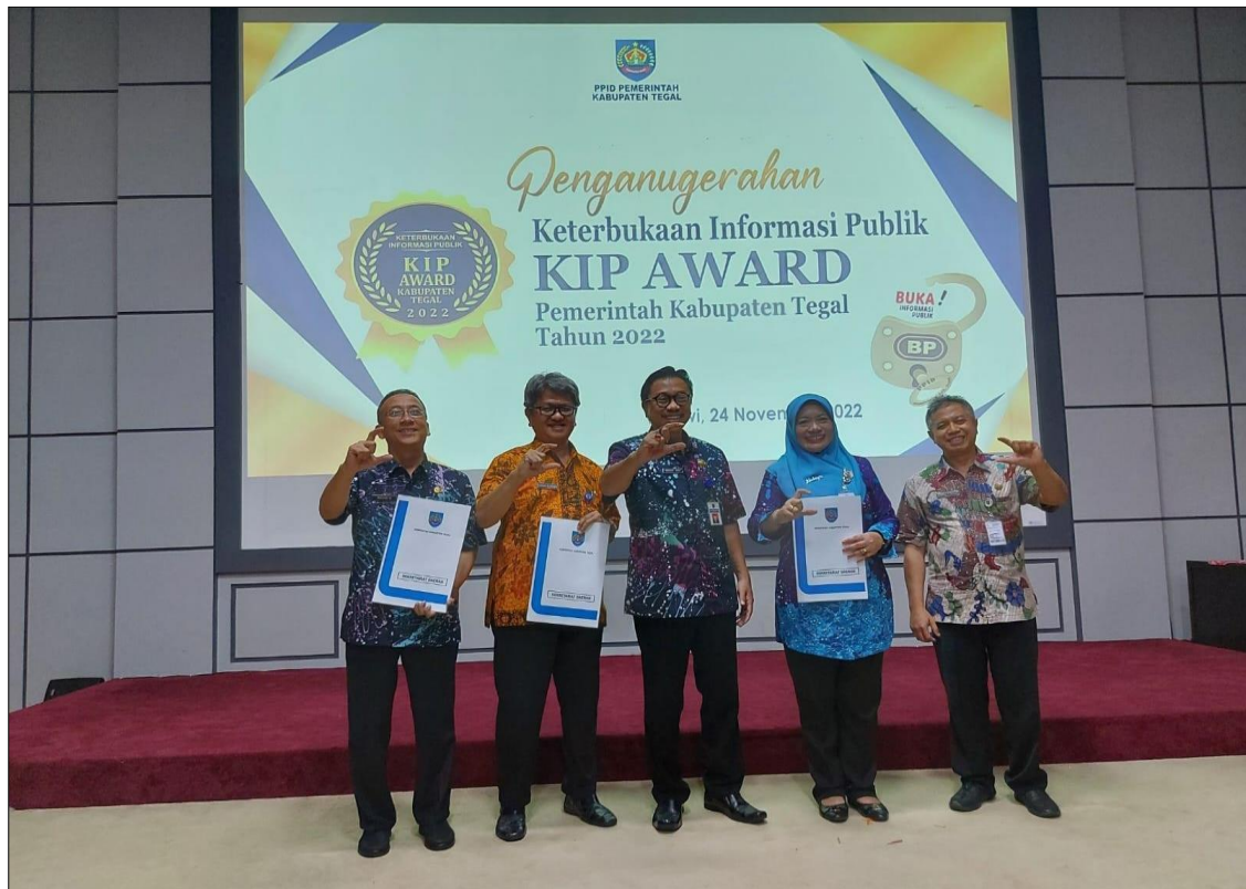
Gambar 5.1 Penganugerahan KIP Award Pemerintah Kabupaten Tegal Tahun 2022

Berikut adalah dokumentasi penganugerahan KIP Award Tahun 2022.